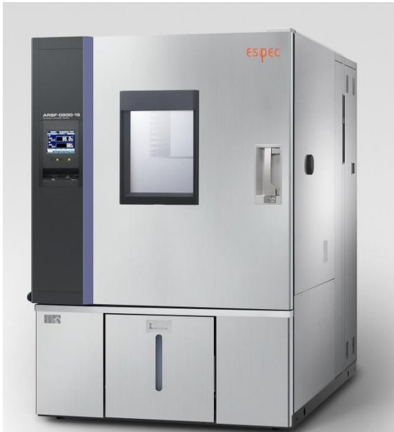
対象設備:ハイパワー恒温恒湿槽(ARSF-0800-15)

M21.5.3:温度変化試験:JIS C 60068-2-14 試験Nb(定速温度変化試験)